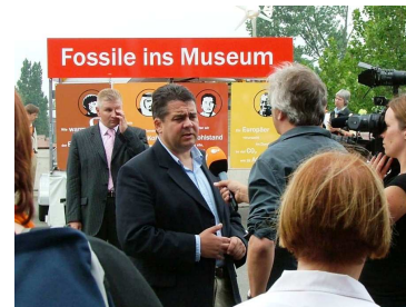
Solar-Insel macht ein gutes Bild beim Ev. Kirchentag in Köln; unten: Bundesumweltminister Gabriel im Interview.