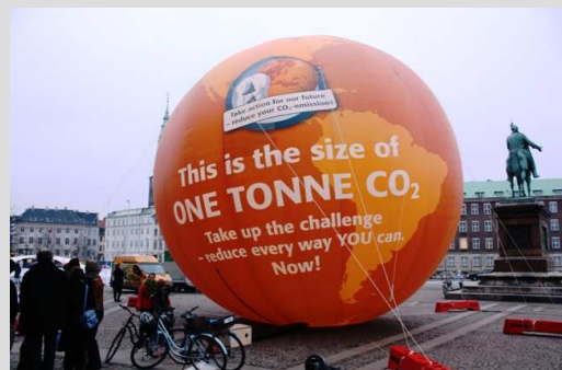
Aktion in Kopenhagen